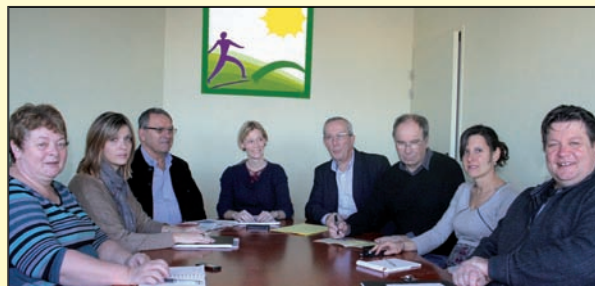
Réunion d'équipe pluridisciplinaire