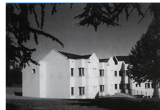
Vue coté Est du bâtiment

15 rue du Docteur Marcland 87025 LIMOGES Cédex